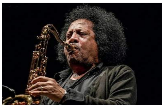
XI EDIZIONE 2017 Direttore artistico: JAMES SENESE