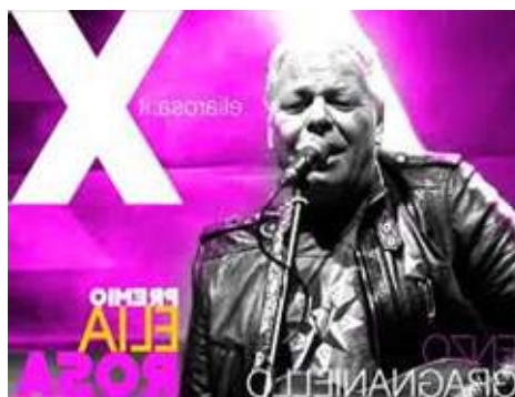
X EDIZIONE 2016 Direttore artistico: ENZO GRAGNANIELLO